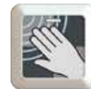
Adesivo Opzione 1