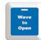
Adesivo Opzione 3