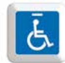
Adesivo Opzione 2