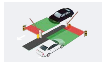
Corsia a doppio accesso