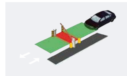
Corsia ad unico accesso