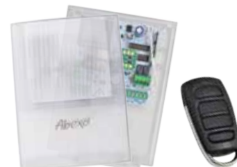
kit centrale per serrande SH230LUX + tx SH4