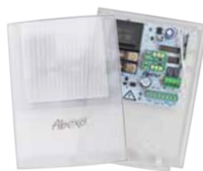
SH230LUX - centrale di comando per serrande avvolgibili