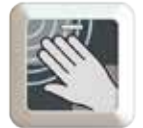
Aufkleber Option 1