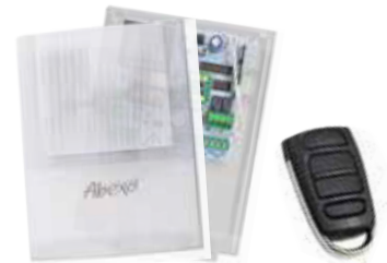
Kit centrale pour rideaux métalliques SH230LUX + tx SH4