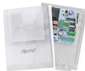
SH230LUX - Centrale de commande pour rideaux métalliques